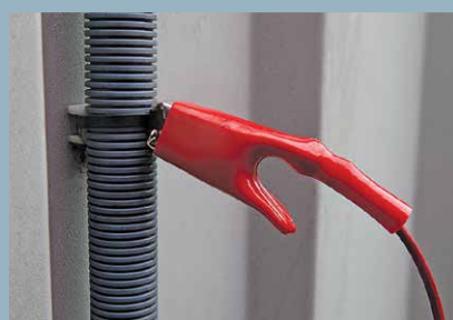
Techniques de suivi du tracé des câbles de petit diamètre