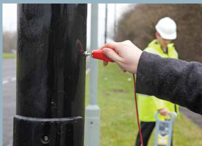
Aimant puissant en néodymium

Les accessoires des Genny3 sont compatibles avec les accessoires Genny4 Pour de plus amples informations sur la large gamme d'accessoires disponibles, veuillez contacter votre bureau Radiodetection local ou visiter notre site www.radiodetection.com