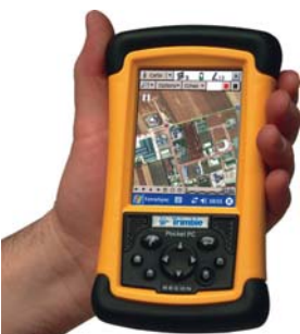
Solution SIG nomade : terminal Recon + ArcPad