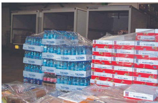
De nombreuses références prêtes à être livrées.

En premier lieu, cet outil fournit de nombreux renseignements sociaux, par exemple le contrôle des relevés d'heures, qui évite les litiges ou les