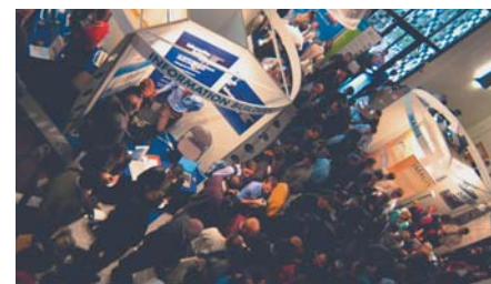
Une petite partie du village partenaires.

- Deuxième prix : attribué à l'ONCFS (Office National de la Chasse et de la Faune Sauvage), pour l'intégration et la consultation de données sur la faune sauvage. Prix offert par D3E Electronique : une licence de l'extension Trimble « GPS-Analyst pour ArcGIS ».